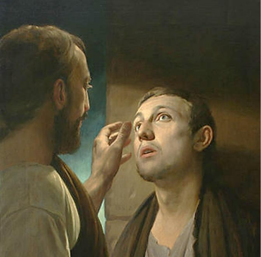
Andrei Nikolayevich Mironov, detail van het schilderij Christus geneest een blinde